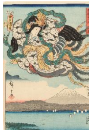
歌川広重・三代歌川豊国『雙筆五十三次江尻』当館蔵

江戸末期の人気絵師、広重・三代豊国・国芳が競演した、東海道シリーズの傑作二種を展示します。あわせて小展示室では浮世絵の中に描かれたいきものたちを紹介します。