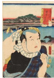
三代歌川豊国『東海道五十三次の内 府中喜多八』当館蔵

商業的なメディアでもあった浮世絵版画、その広告としての側面を紹介します。わかりやすいものから意外なものまで、さまざまな浮世絵版画の例をご覧ください。