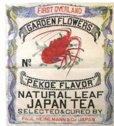
作者不詳『(蘭字)』個人蔵