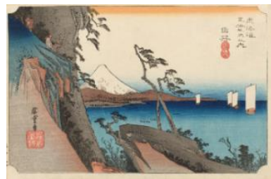
歌川広重『東海道五拾三次之内 由井 薩埵嶺』当館蔵

『東海道五拾三次之内』(保永堂版)、『東海道五十三次之内』(行書)、『東海道』(隸書)。広重の東海道三シリーズを一挙公開します。