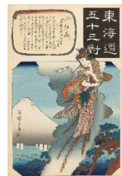
歌川広重『東海道五十三對 江尻 三保の浦羽衣松の由来』当館蔵