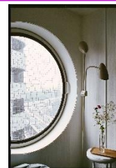
『KUROKAWA KISHO'S NAKAGIN CAPSULE TOWER』TOKYO HYAKU by Giuseppe De Francesco