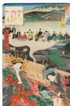
東海道 京都名所之内 島原 落合芳幾

浮世絵の中には変わった格好の人や動物、宣伝広告やヒット祈願など様々な情報が描き込まれています。“うきよえ探検隊”になって絵の中の〇〇を探してみましょ!