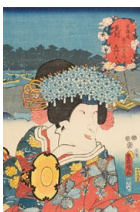
東海道五十三次の内 見附しづか 三代歌川豊国

小袖の模様や櫛やキセルなどの図案を収録したデザイン集「雛形本」と当時の世相を描いた「浮世絵」。ふたつの資料で江戸の服飾やデザインを紹介します。