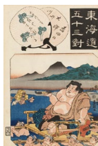
東海道五十三對 島田の驛 大井川 三代歌川豊国