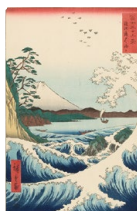
富士三十六景 駿河薩タ之海上