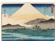
不二三十六景 駿河富士沼

広重が晩年に挑戦した富士を描いたふたつのシリーズ『不二三十六景』と『富士三十六景』。北斎とはまた趣の異なる広重の富士を紹介します。