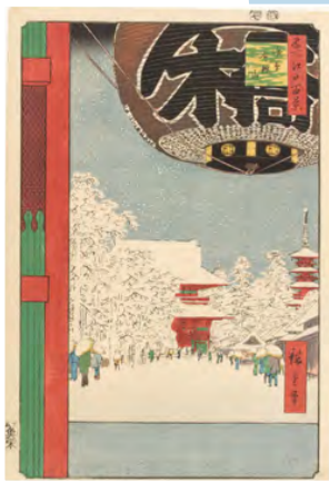
歌川広重『名所江戸百景 浅草金龍山』当館蔵 (Part2展示)