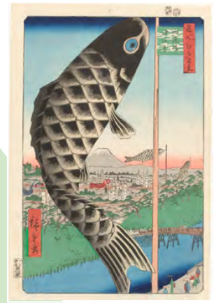
歌川広重『名所江戸百景 水道橋駿河臺』 当館蔵(Part2展示)