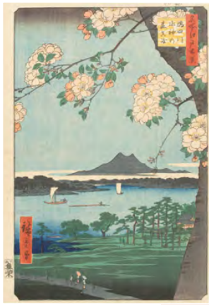
歌川広重『名所江戸百景 隅田川水神の森真崎』 当館蔵 (Part1展示)

江戸時代の太陰太陽暦(旧暦)で使用されていた季節区分に合わせ、浮世絵に描かれた四季折々の風景や風俗を紹介します。