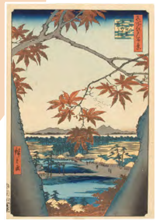
歌川広重 『名所江戸百景 真間の紅葉手古那の社繼はし』 当館蔵 (Part1展示)