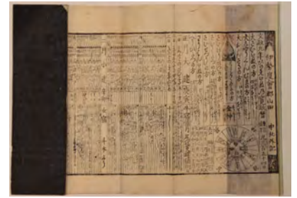
文政九年(1826) 伊勢暦 蛇足庵 蔵