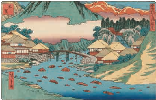
[Part2 展示作品] 歌川広重 『箱根七湯図會 木質』 当館蔵