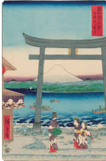
[Part1 展示作品] 歌川広重 『富士三十六景 相模江之島入口』 当館蔵