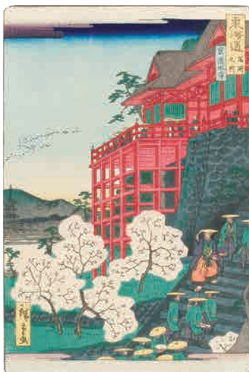
[Part3 展示作品] 二代歌川広重 『東海道名所之内 京清水寺』 当館蔵