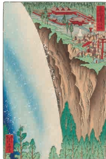
[Part2 展示作品] 河鍋暁斎 『東海道名所之内 那智ノ瀧』 当館蔵