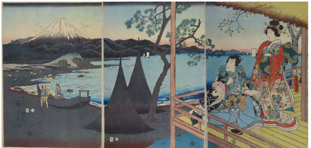
[Part2展示作品] 歌川広重・三代歌川豊国「田子のうら風景」当館蔵