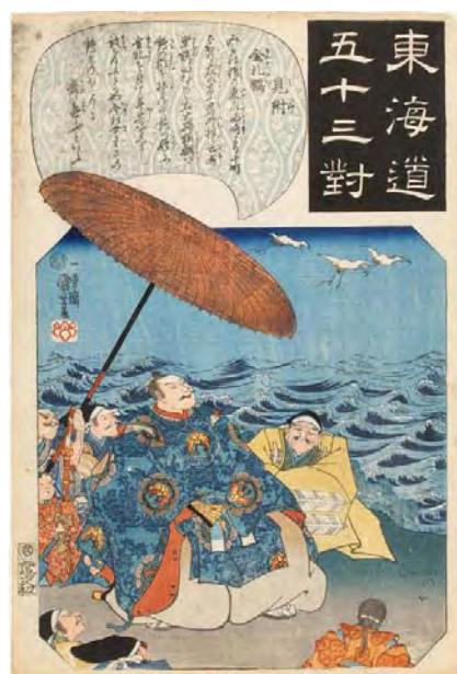
[Part2展示作品] 歌川国芳 『東海道五十三對 見附 金札鶴』当館蔵