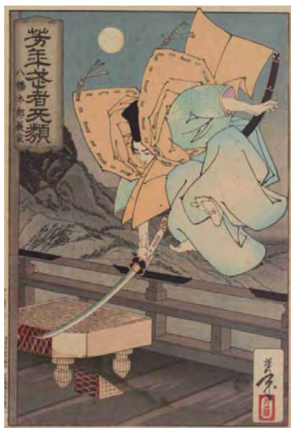
[Part1展示作品] 大蘇芳年(月岡芳年) 『芳年武者天類 源義家』静岡県立中央図書館蔵