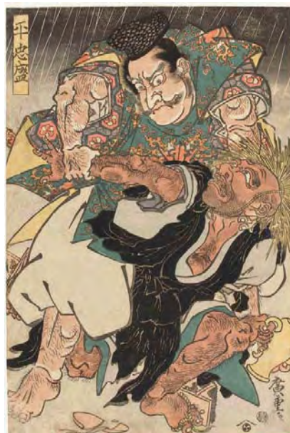
[Part2展示作品] 歌川広重『平忠盛』当館蔵