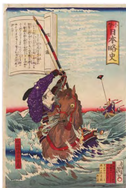
[Part1展示作品] 小林清親『小學日本略史 壇の浦』静岡県立中央図書館蔵