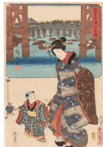
[Part1展示作品] 歌川広重、三代歌川豊国 『雙筆五十三次 日本橋』当館蔵