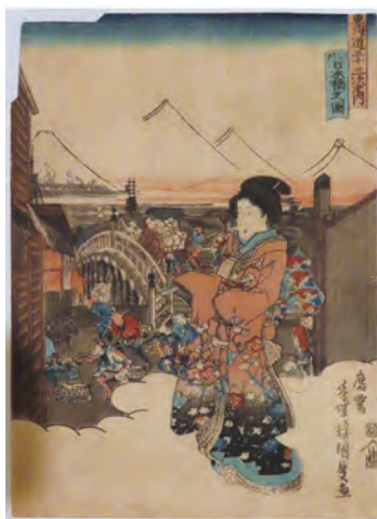
[Part1展示作品] 歌川国貞(三代歌川豊国) 『東海道五十三次之内 江戸 日本橋之圖』丁子屋蔵