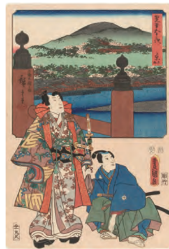
[Part2展示作品] 歌川広重、三代歌川豊国 『雙筆五十三次 京 大尾 三條大橋之圖』当館蔵