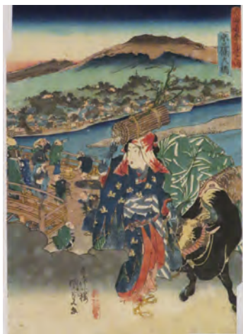
[Part2展示作品] 歌川国貞(三代歌川豊国) 『東海道五十三次之内 京 三條大橋』丁子屋蔵