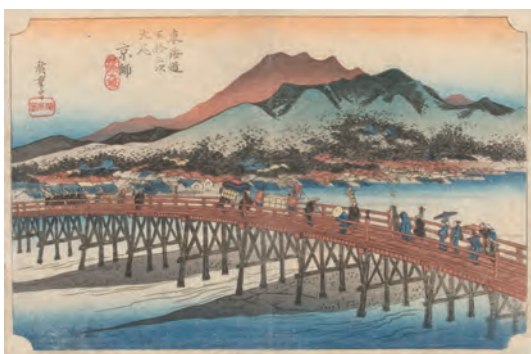
[Part2展示作品] 歌川広重 『東海道五拾三次 大尾 京師 三條大橋』当館蔵