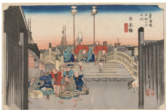
[Part1展示作品] 歌川広重 『東海道五拾三次之内 日本橋 朝之景』当館蔵