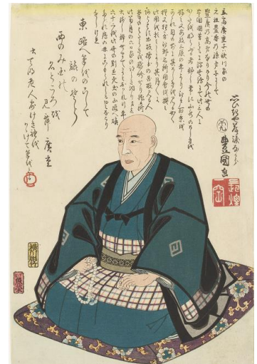
三代歌川豊国『広重死絵』当館蔵