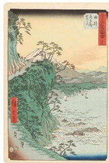
左 歌川広重『五十三次名所圖會 十七 田井 薩多禰親しらす』 当館蔵 右 歌川広重『東海道 十六 五十三次之内 蒲原』 当館蔵

旅情あふれる『五十三次名所圖會』（豎絵東海道）、『東海道五十三次之内』（寫屋版東海道）と共に、静岡市内の東海道「二峠六宿」を描いたバラエティ豊かな名品を紹介。