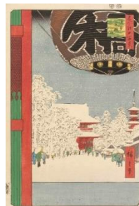
左 歌川広重『名所江戸百景 浅草金龍山』 当館蔵 右 三代歌川豊国『東海道五十三次之内 田井 志のぶ』 当館蔵

広重晩年の傑作『名所江戸百景』をはじめとした赤が印象的な名品と共に、浮世絵にも通じる染料「紅花」など、天然の素材を用いた美術家・辻けいの作品から、赤の表現を探る。