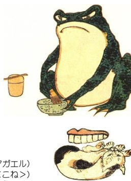
左上 歌川重宣（二代広重）『勝手道具はんじもの下』（一部）蛇足庵蔵 《答え》茶釜（茶をたてるガマガエル） 左下 一鶴斎芳藤『東海道五十三次はんじ物』（一部）蛇足庵蔵 《答え》箱根（函・逆さのねこくこね） 右 歌川広重『富士三十六景 はこねの湖すい』 当館蔵

地名や道具名を絵で解くなぞなぞ「判じ絵」。その種明かしとなる広重の名所絵『東都名所』や『名所江戸百景』を併せて展示する。