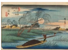
左 歌川広重『木曾海道六拾九次之内 洗馬』 当館蔵 右 歌川広重『名所江戸百景 深川萬年橋』 当館蔵

広重の名品『木曾海道六拾九次之内』をはじめ、浮世絵の復興を目指した新版画、現代の創作版画を紹介。時代と共に変化した、風景版画の歴史をたどる。