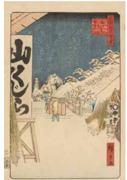
Part 2展示作品 歌川広重 『名所江戸百景 びくにはし雪中』 当館蔵