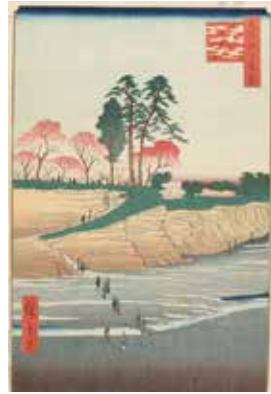
Part 1展示作品(左) ジュゼッペ・デ・フランチェスコ 『東京百 御殿やまのち台場』