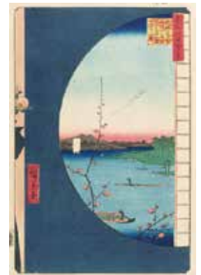
Part 2展示作品(右) ジュゼッペ・デ・フランチェスコ 『東京百 中銀より汐留の庭 浜の離宮を見る図』