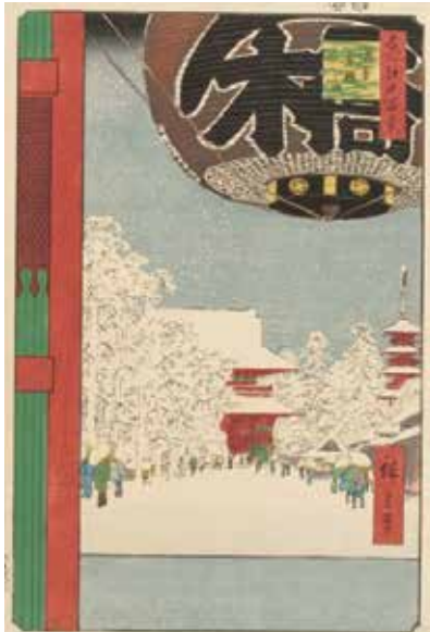
Part 1展示作品 歌川広重 『名所江戸百景 浅草金龍山』 当館蔵