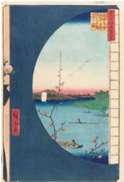
Part 2展示作品 歌川広重 『名所江戸百景 真崎邊より水神の森内川関屋の里を見る圖』 当館蔵