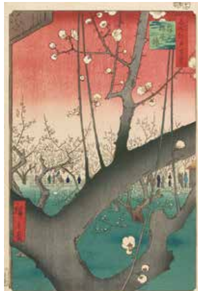
Part 2展示作品 歌川広重 『名所江戸百景 亀戸梅屋舗』 当館蔵