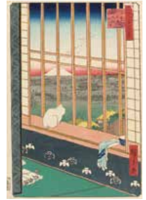
Part 1展示作品(右) ジュゼッペ・デ・フランチェスコ 『東京百 豊島池袋猫のカフェ詣』