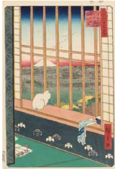
Part 1展示作品 歌川広重 『名所江戸百景 浅草田圃西の町詣』 当館蔵