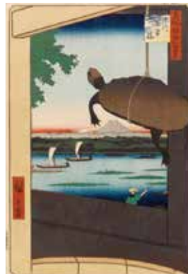
Part 2展示作品(左) ジュゼッペ・デ・フランチェスコ 『東京百 谷中萬年束子』