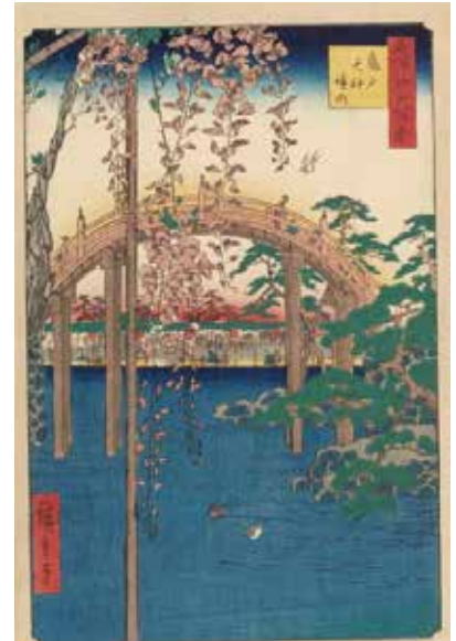
Part 1展示作品 歌川広重 『名所江戸百景 亀戸天神境内』 当館蔵