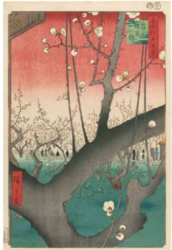
Part 2 展示作品 歌川広重『名所江戸百景 亀戸梅屋舗』当館蔵