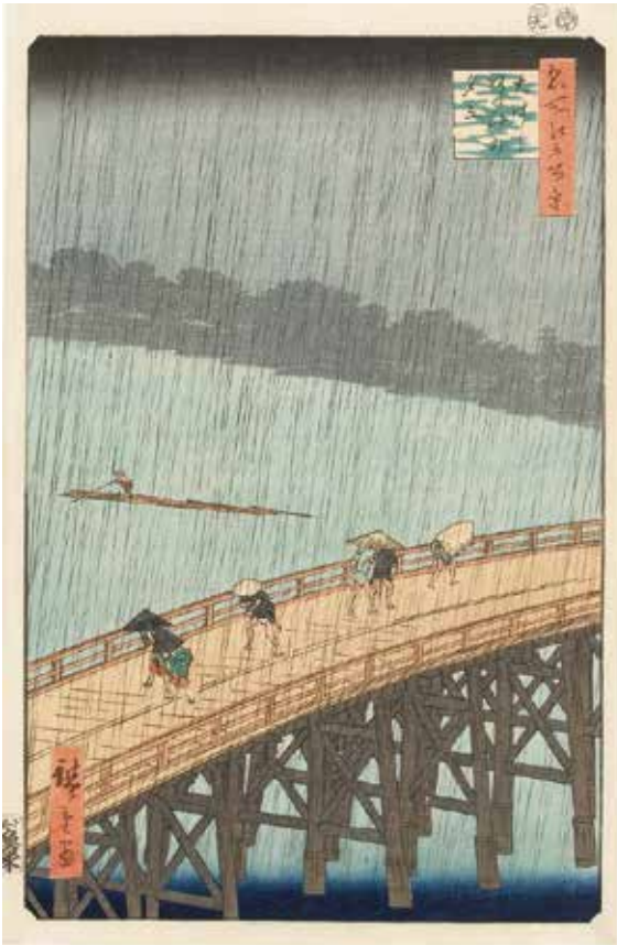
Part 1 展示作品 歌川広重『名所江戸百景 大はしあたけの夕立』当館蔵

「ひまわり」や「夜のカフェテラス」で知られるオランダの画家ファン・ゴッホは浮世絵の熱心なコレクターとしても有名で、ジャポネズリー（日本趣味）と題した浮世絵の模写作品を残しています。無数に降り注ぐ墨の線で表現された勢いのある雨と、急な雨に先を急ぐ橋上の人々が見る者に音や動きを感じさせる「大はしあたけの夕立」、手前の景色を極端に大きく描いた大胆な遠近表現と、赤と緑のコントラストが目を引き「亀戸梅屋敷」。ゴッホが魅了された『名所江戸百景』の逸品をご覧ください。