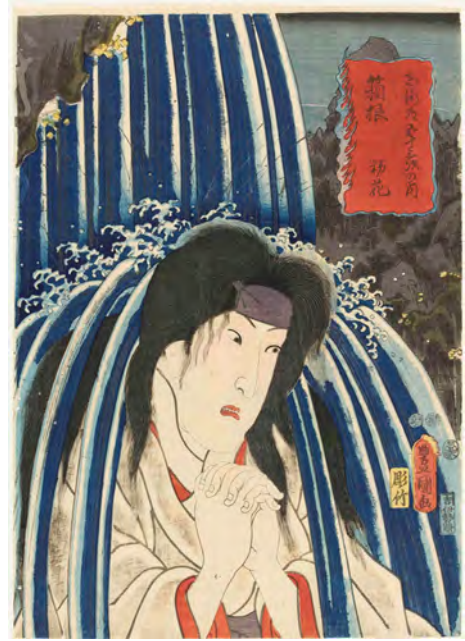
[Part2展示作品] 三代歌川豊国『東海道五十三次の内 箱根 初花』当館蔵