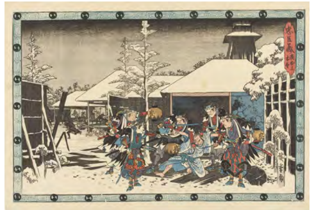
[Part2展示作品] 歌川広重『忠臣蔵 夜討三本望』当館 蔵