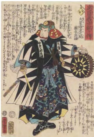
[Part1展示作品] 歌川芳虎 『忠臣義士銘々傳い 大星由良之助藤原良雄』 静岡県立中央図書館 蔵

元禄十四～十六年(1701～1703)に起こった赤穂事件を題材とした『仮名手本忠臣蔵』が初めて上演されたのは、寛延元年(1748)8月。大坂道頓堀の竹本座で人形浄瑠璃の演目として興行されました。この興行は大変な好評を博し、同年の12月には大坂で歌舞伎化。翌二年(1749)2月には江戸でも上演されました。