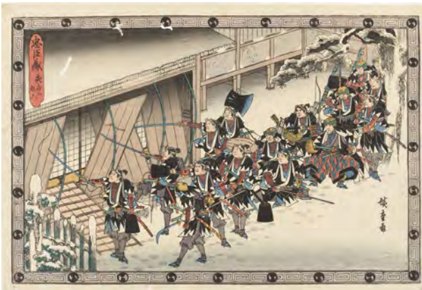
[Part2展示作品] 歌川広重『忠臣蔵 夜討二乱入』

『仮名手本忠臣蔵』は多くの先行作を取り入れて練られた作品で、幕府の批判・風刺などの取締りや規制を避けるため、物語の舞台を室町時代の『太平記』に移し、浅野内匠頭は鎌倉後期から南北朝時代にかけて実在した塩冶判官高貞、吉良上野介は同じく実在の足利家執事 高師直に置き換え、大石内蔵助は大星由良之助に役名を変えて演じられています。題名は、いろは仮名47文字と討入を果たした赤穂藩の浪人47人(四十七士)が同数であることをかけ、文字の手習いの手本と武士の手本となる忠臣が集まった蔵であるとともに、大石内蔵助の名ともかけられています。本展ではこの「忠臣蔵」を題材にした浮世絵作品とともにそのあらすじをご紹介します。