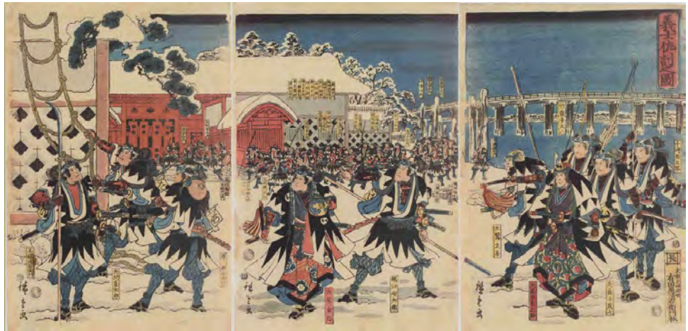
[Part1展示作品] 歌川広重『義士仇討之圖』静岡県立中央図書館 蔵

『仮名手本忠臣蔵』は多くの先行作を取り入れて練られた作品で、幕府の批判・風刺などの取締りや規制を避けるため、物語の舞台を室町時代の『太平記』に移し、浅野内匠頭は鎌倉後期から南北朝時代にかけて実在した塩冶判官高貞、吉良上野介は同じく実在の足利家執事 高師直に置き換え、大石内蔵助は大星由良之助に役名を変えて演じられています。題名は、いろは仮名47文字と討入を果たした赤穂藩の浪人47人(四十七士)が同数であることをかけ、文字の手習いの手本と武士の手本となる忠臣が集まった蔵であるとともに、大石内蔵助の名ともかけられています。本展ではこの「忠臣蔵」を題材にした浮世絵作品とともにそのあらすじをご紹介します。