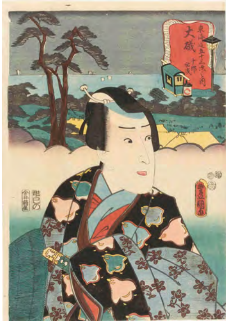
[Part1展示作品] 三代歌川豊国『東海道五十三次之内 大磯 十郎祐成』当館蔵

「忠臣蔵」と並び、日本三大仇討ともいわれる「曾我物語」、「鍵屋辻の決闘」など浮世絵に描かれた仇討物語を紹介します。江戸時代に定められた仇討のルールとともに単純な復讐成功譚にとどまらない、仇討物語の魅力をお楽しみください。