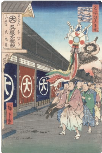
[Part2 展示作品] 歌川広重 『名所江戸百景 大傳馬町こぶく店』当館蔵