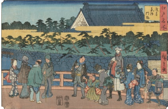
[Part1 展示作品] 歌川広重 『江戸名所 浅草東御門跡』当館蔵