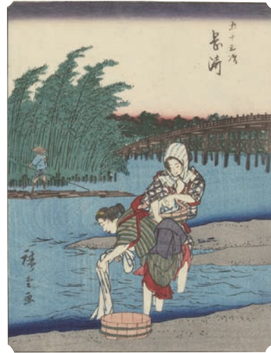
[Part1 展示作品] 歌川広重 『五十三次 岡崎』当館蔵