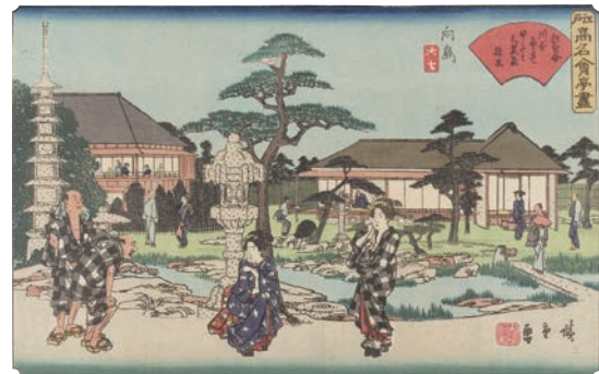
[Part2 展示作品] 歌川広重 『江戸高名會亭盡 向島 大七』当館蔵