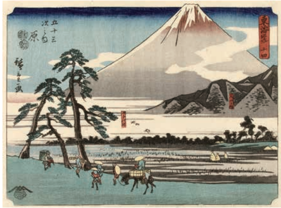
[Part1 展示作品] 歌川広重 『東海道 十四 五十三次原』当館蔵