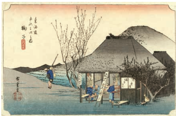
[Part2 展示作品] 歌川広重 『東海道五拾三次之内 鞠子 名物茶店』当館蔵