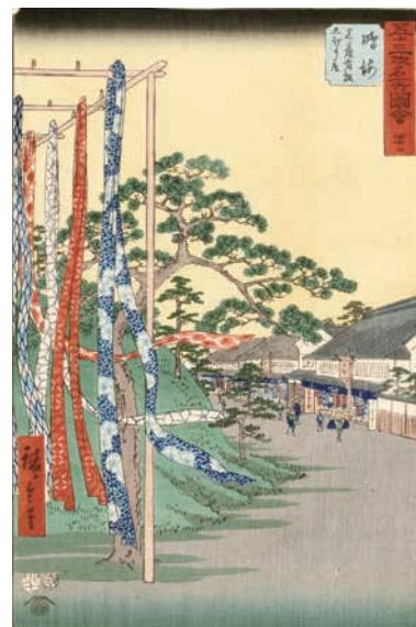
[Part3 展示作品] 歌川広重 『五十三次名所圖會 鳴海 名産有松しほり店』当館蔵