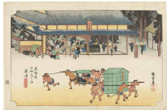
[Part2 展示作品] 歌川広重 『東海道五拾三次之内 草津 名物立場』当館蔵