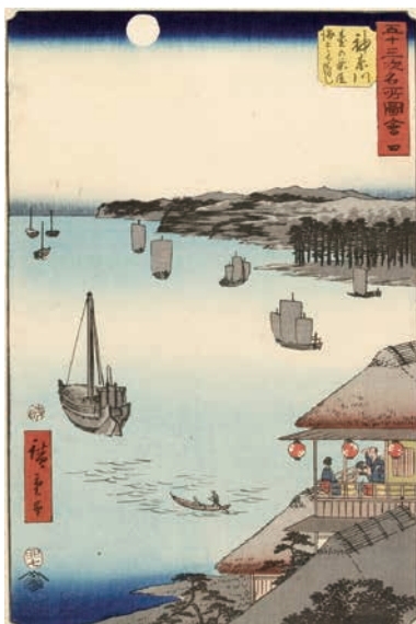
[Part3 展示作品] 歌川広重 『五十三次名所圖會 神奈川 臺の茶屋海上見はらし』当館蔵