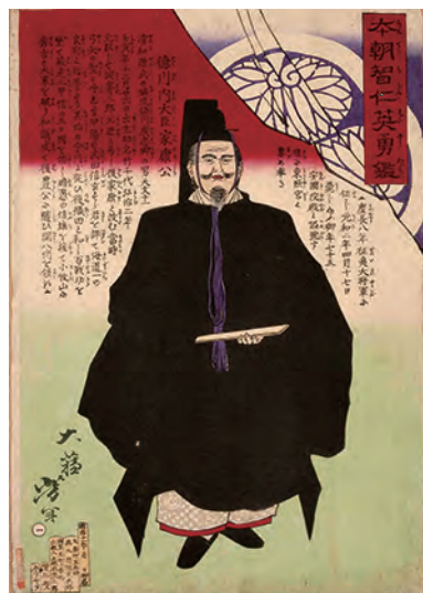
[Part1 展示作品] 大蘇芳年(月岡芳年) 『本朝智仁英勇鑑 徳川内大臣家康公』

今川家の人質時代も含め人生の1/3を過ごした静岡の町には、家康にまつわる多くの史跡が残されています。本展では静岡の寺社などに残る家康関連資料とともにその足跡を紹介します。