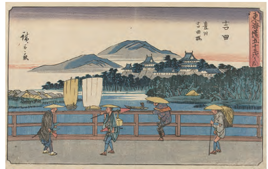
[Part1 展示作品] 歌川広重 『東海道五十三次之内 吉田 豊川 吉田橋』当館蔵