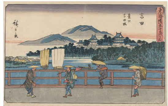
[Part1 展示作品] 歌川広重 『東海道五十三次之内 吉田 豊川 吉田橋』当館蔵