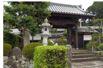
林香寺 (西湖山林香寺)