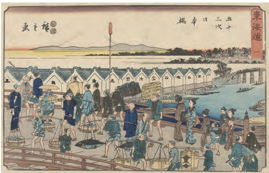
[Part2 展示作品] 歌川広重 『東海道 一 五十三次 日本橋』当館蔵

嘉永二～五年(1849～1852)刊。標題が隷書体の文字で書かれていることから通称「隷書東海道」と呼ばれるシリーズ。