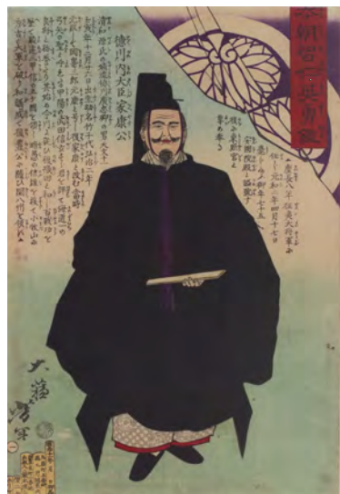
[Part1 展示作品] 大蘇芳年(月岡芳年) 『本朝智仁英勇鑑 徳川内大臣家康公』 静岡県立中央図書館蔵

今川家の人質時代も含め人生の1/3を過ごした静岡の町には、家康にまつわる多くの史跡が残されています。本展では静岡の寺社などに残る家康関連資料とともにその足跡を紹介します。