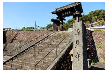
清見寺 (巨龍山清見興国禅寺)