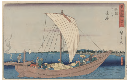
[Part2 展示作品] 歌川広重 『東海道 四十三 五十三次 菜名 七里の渡舟』当館蔵