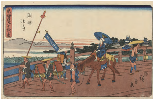
[Part1 展示作品] 歌川広重 『東海道五十三次之内 岡崎 矢はぎのはし』当館蔵

天保十二～十四年(1841～1843)刊。間判錦絵横。標題が行書体の文字で書かれていることから通称「行書東海道」と呼ばれるシリーズ。