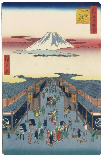
【Part2 展示作品】歌川広重 『名所江戸百景 する賀てふ』 当館蔵