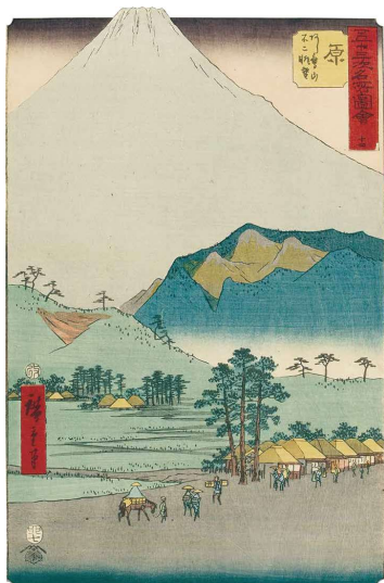
[Part1 展示作品] 歌川広重 『五十三次名所圖會 十四 原 あし鷹山不二眺望』 当館蔵