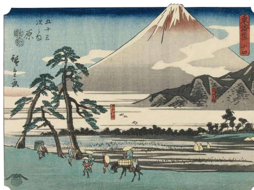
[Part1 展示作品] 歌川広重 『東海道 十四 五十三次之内 原』 当館蔵