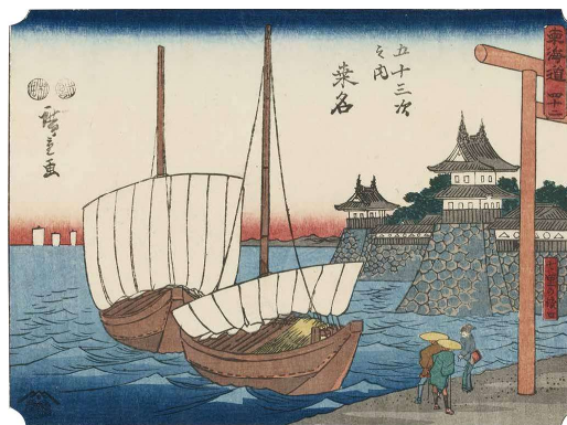
[Part2 展示作品] 歌川広重 『東海道 四十二 五十三次之内 湊名』 当館蔵