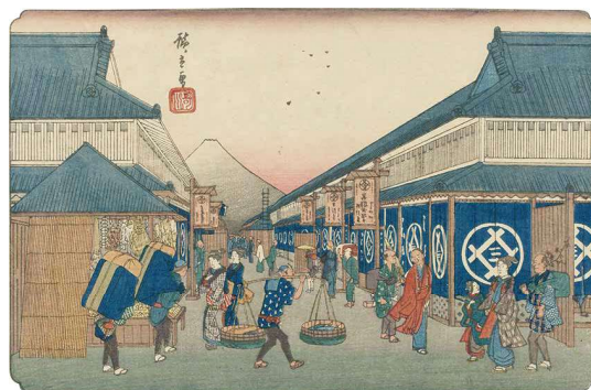
【Part2 展示作品】歌川広重 『東都名所 駿河町之圖』 当館蔵