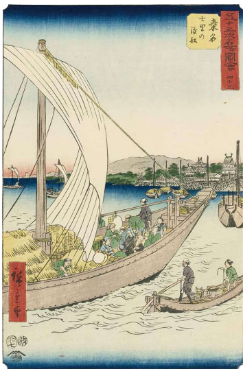
[Part2 展示作品] 歌川広重 『五十三次名所圖會 四十三 湊名 七里の渡船』 当館蔵