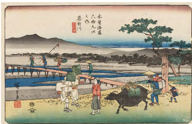
[Part1展示作品] 歌川広重 『木曾海道六拾九次之内 六拾六 恵智川』当館蔵