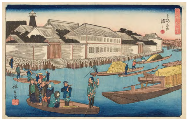
[Part1展示作品] 歌川広重 『江都勝景 よろみの渡し』当館蔵