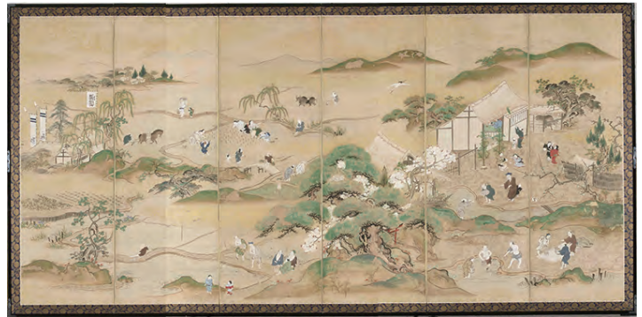
[Part1展示作品] 『四季農耕図屏風』当館蔵