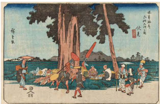
[Part2展示作品] 歌川広重 『木曾海道六拾九次之内 五十壺 伏見』当館蔵