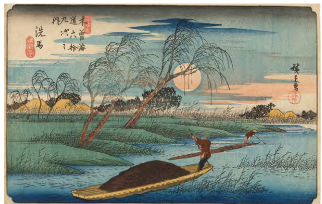
[Part2展示作品] 歌川広重 『木曾海道六拾九次之内 三拾貳 洗馬』当館蔵