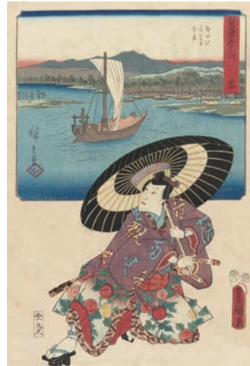
[Part1 展示作品] 歌川広重、三代歌川豊国 『雙筆五十三次 宮 熱田駅 寝覚里 遠景』 当館蔵