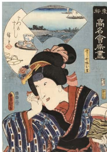
[Part2 展示作品] 歌川広重、三代歌川豊国 『東都高名會席盡 まつのすし すしや娘お里』 当館蔵