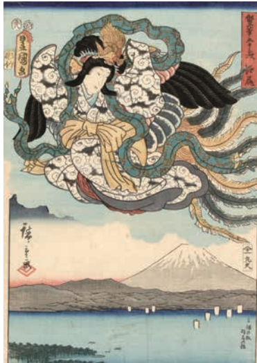
[Part1 展示作品] 歌川広重、三代歌川豊国 『雙筆五十三次 江尻 三保の松 羽衣の松』 当館蔵