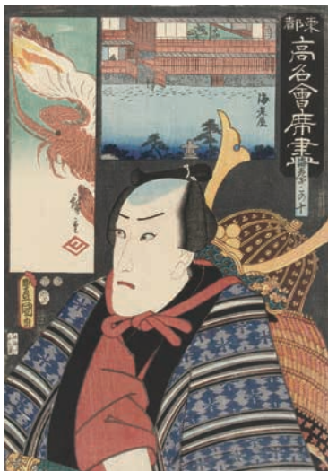
[Part2 展示作品] 歌川広重、三代歌川豊国 『東都高名會席盡 海老屋 海老ざこの十』 当館蔵