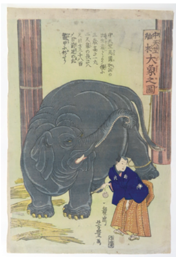
[Part2 展示作品] 歌川芳豊 『中天竺舶來 大象之圖』 当館蔵