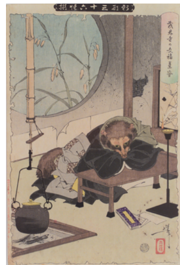
[Part2 展示作品] 月岡芳年 『新形三十六怪撰 茂林寺の文福茶釜』 静岡県立中央図書館蔵