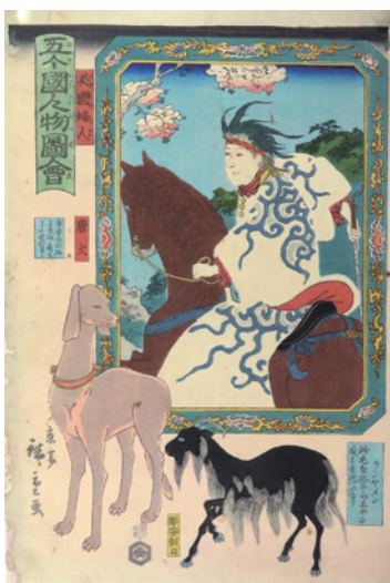
[Part2 展示作品] 二代歌川広重 『五ヶ國人物圖會 英國婦人 唐犬 ラシヤメン』 当館蔵