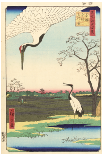
[Part1 展示作品] 歌川広重 『名所江戸百景 菱輪金杉三河しま』 当館蔵