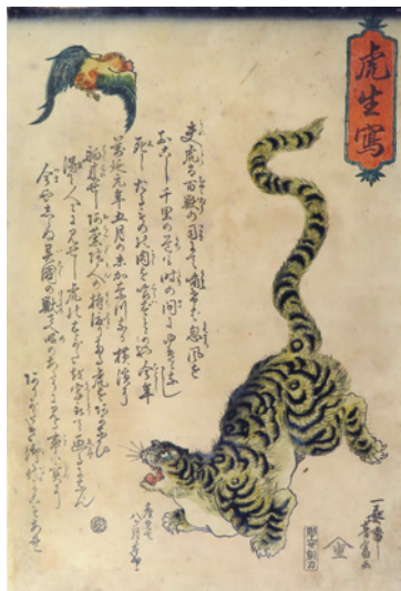
[Part1 展示作品] 歌川芳富 『虎生寫』 当館蔵