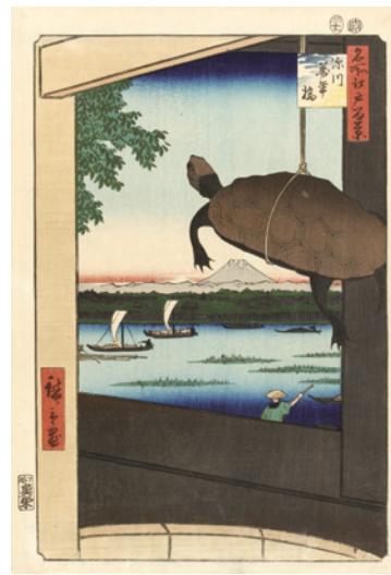
[Part1 展示作品] 歌川広重 『名所江戸百景 深川萬年橋』 当館蔵