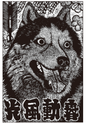
[中学生・高校生の部] 応募作品