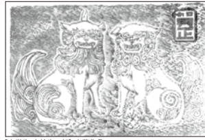
[中学生・高校生の部] 応募作品