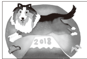
[小学生の部] 応募作品